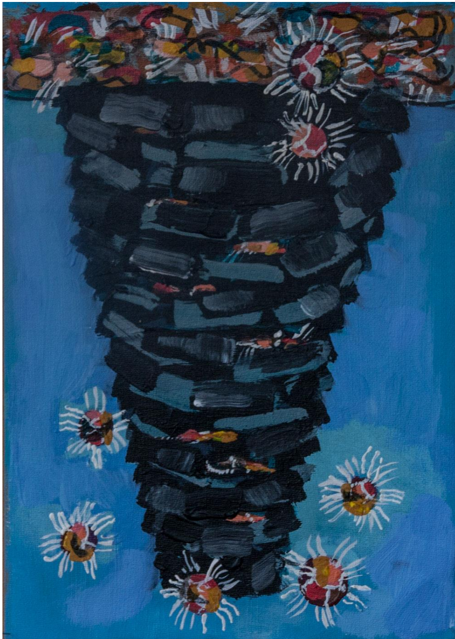
Вихрь чёрных пластин.