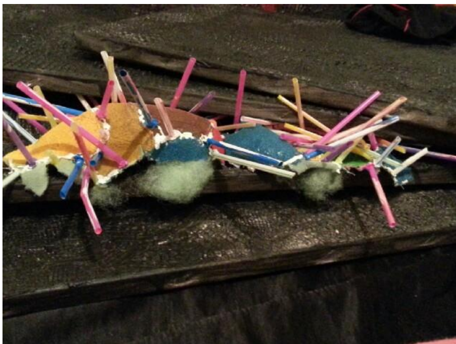
И то, как пластины чёрного вихря разрывают их.