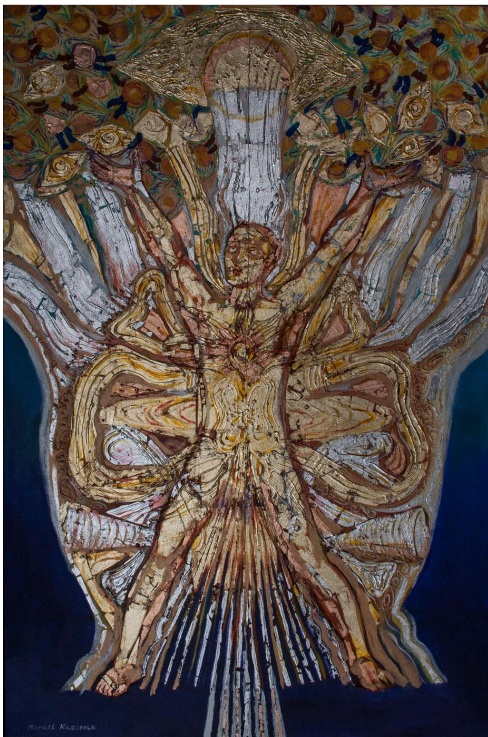
Это портрет энергетического тел . Точка сборки находится в центре. Сердечный центр - цветок огня.