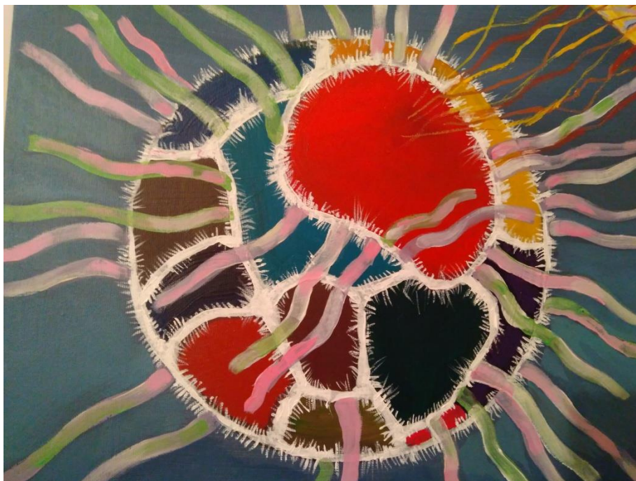
Объединенные три Внимания Осознания существ.